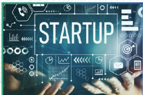
START UP COMPETITION KHỞI NGHIỆP