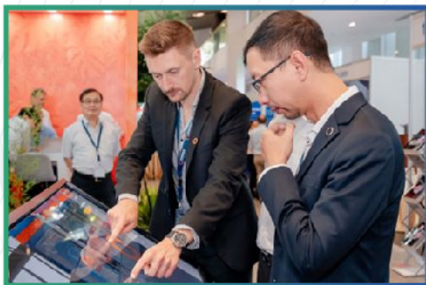
20 TECH SESSIONS 20 PHIÊN THẢO LUẬN