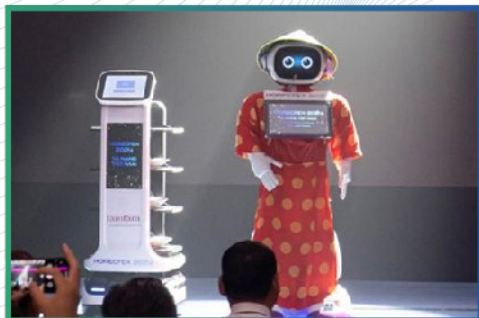
ROBOTS NGƯỜI MÁY