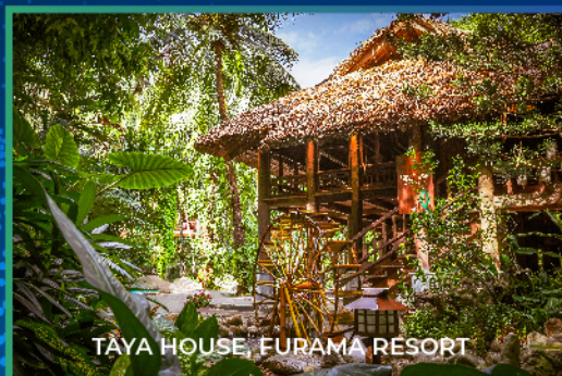
TÀYA HOUSE, FURAMA RESORT

OUR COMMITMENT TO SUSTAINABILITY CAM KẾT CỦA CHÚNG TÔI VỀ PHÁT TRIỂN BỀN VỮNG