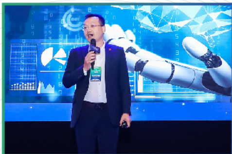
ARTIFICIAL INTELLIGENCE TRÍ TUỆ NHÂN TẠO